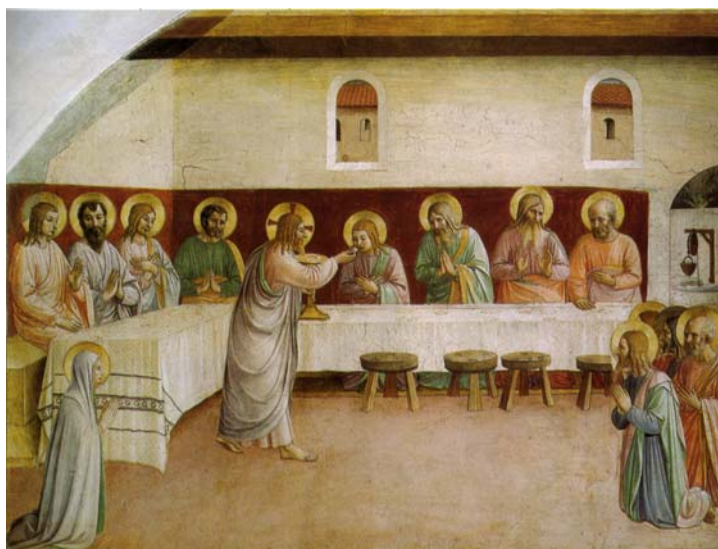
Fra Angelico 1441 Firenze, San Marco kolostor, Utolsó vacsora